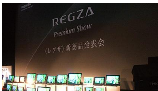
【株式会社 東芝 REGZA】

高画質デジタルシネマ・プロジェクターをはじめとする最新映像・音響設備を導入したスクリーンを使い、企業様の各種イベントをサポートしております。