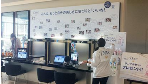
【ユニリーバ・ジャパン ダウ】

スクリーン開場までお客様が滞留する劇場ロビーを活用して顧客獲得の各種展開、商品タッチ&トライ、アンケート調査などが可能です。